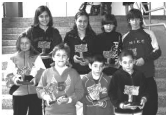
CAMPEONES ESCOLARES CANTABRIA 06-07

La primera fase, como ya viene siendo habitual, se disputó en los salones de la biblioteca de la facultad de Medicina de la Universidad de Cantabria, y contó con la participación de más de 350 jugadores de edades comprendidas entre los 7 y los 16 años. Como novedad respecto a ediciones anteriores en esta primera fase el campeón de la categoría Cadete era directamente seleccionado para formar parte de la Selección Cántabra en los Campeonatos de España de la Juventud, que en esta edición se celebraron a finales de Junio en la localidad jienense de Linares.