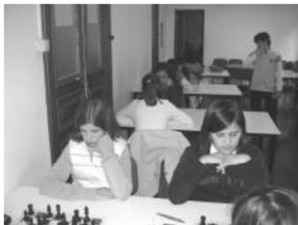
PARONÁMICA SALA DE JUEGO 2ª FASE

La nota predominante de esta segunda fase fue la gran igualdad entre todos los jugadores, lo que hizo que en la última ronda varios jugadores tuvieran posibilidades de clasificarse.